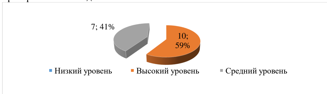
Рис. 3. Результаты общего уровня развития детей по итоговой диагностике в 2025г

С момента поступления ребенка в детский сад я веду мониторинг их развития с помощью целенаправленного наблюдения и педагогической диагностики. Для педагогической диагностики использовалась методика, затем Н. В. Верещагиной. В этом году я попробовала провести диагностику строго по критериям ФГОС и ФОП ДО, представленным в образовательной программе МАДОУ 66, так как в этом случае результаты получаются максимально достоверными и согласуются с результатами наблюдения. Ниже на рисунке 3 представлены результаты педагогической диагностики, проверенные наблюдениями.